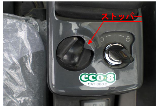
アクセルダイヤルの型枠によりアクセル 80%以上にならない設計になっております。