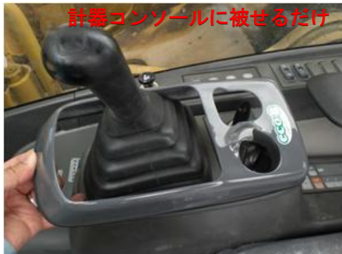
計器コンソールに被せるだけで、 すっきり収まります。

計器コンソールに被せる簡単タイプでリース機でも使用可能です。 機種に合わせて成形してあるので、スッキリとコンソールに収まります。